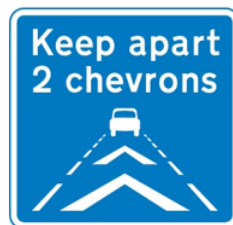
Speed regulation with keeping vehicles apart by 2 chevrons