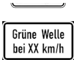
Green wave indicator