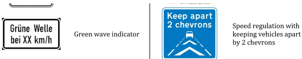
Obrázek 4 - Ukáзка části tabulky s příklady dopravních značek (tabulka C.19 normy)

Tato příloha (rozsah 9 stran) obsahuje 10 obrázků značek omezujících rychlost (i nepřímou, podle rychlosti vozidla vpředu) a jejich krátký popis.