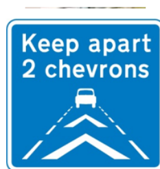
Speed regulation with keeping vehicles apart by 2 chevrons