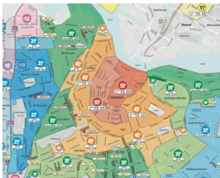
Obrázek 1 — Parkovací zóny v Amsterdamu s jasně definovanými cenami za parkovné pro návštěvníky (obr. 1 v popisovaném dokumentu)

Níže je pro ukázkou uveden obrázek 1 dokumentu, který ilustruje zónové vymezení dopravy v Amsterdamu jako základní krok pro zónovou regulaci a využití geofencingu, jako Krok 2 dané strategie (článek 7.2.3).