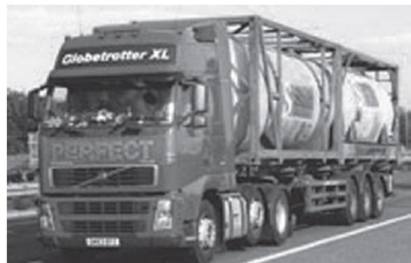
Obrázek 2: Příklady tahače a dvou ISO kontejnerů (dle schématu na obrázku 1 výše) (Obrázek 6 normy)