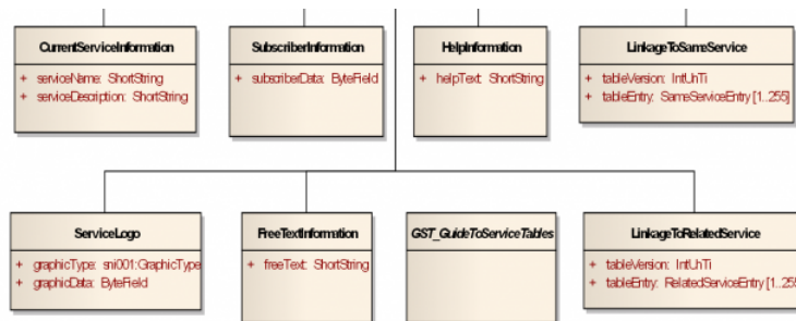
Obrázek 2 - Obecné třídy SNI stanovené v kapitole 8 dokumentu (výřez obr. 6 dokumentu)

Články 8.2 až 8.6 stanovují atributy (rozsahy, typy, příklady) obecných tříd (viz následující obrázek) vyskytujících se v SNI, tak jak byly tyto třídy ukázány na obrázku v kapitole 7.