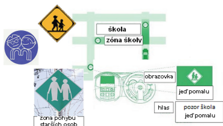
Obrázek 3 – Informace o dopravní zóně (D.1.7 s nabídkou silničních informací)

System může nabízet řidiči informace o momentálním využití místní pozemní komunikace, například o rozdělení pozemní komunikace na část využívanou chodci a část využívanou vozidly, za účelem zvýšení bezpečnosti žáků a dětí při cestě do školy.