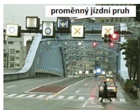
Obrázek 2 – Informace o jízdních pruzích (D.1.3 s přehledem informačních služeb k jízdnímu pruhu )