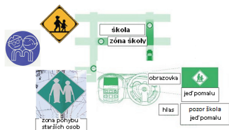
Obrázek 3 – Informace o dopravní zóně (D.1.7 s nabídkou silničních informací)

System může nabízet řidiči informace o momentálním využití místní pozemní komunikace, například o rozdělení pozemní komunikace na část využívanou chodci a část využívanou vozidly, za účelem zvýšení bezpečnosti žáků a dětí při cestě do školy.