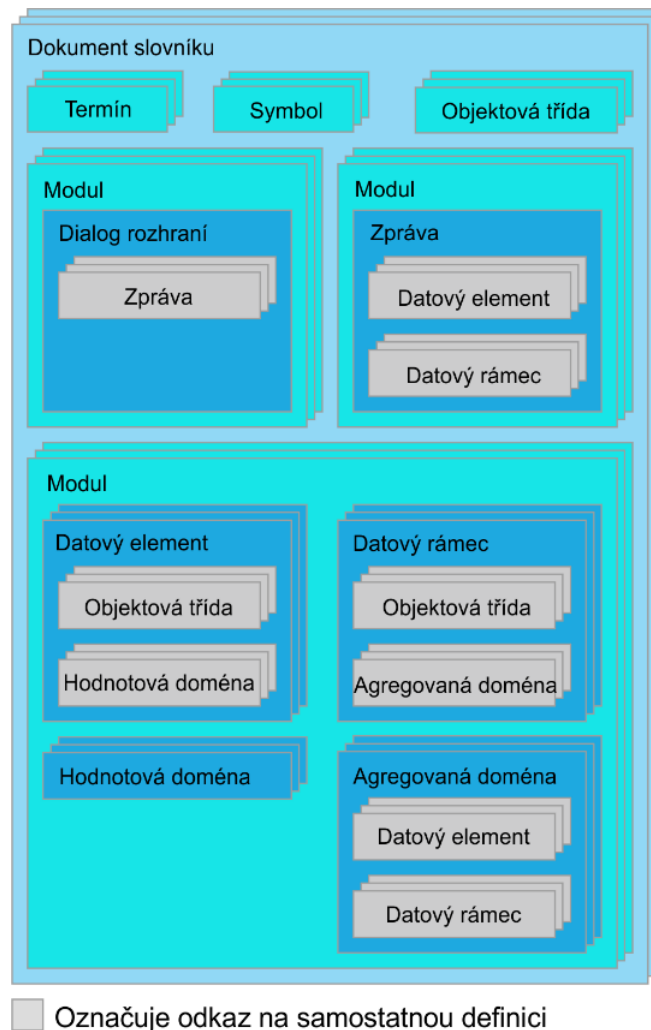
Obrázek 2 — Dokumentace datových konceptů

Tato kapitola o 7 stranách vysvětluje 9 datových konceptů pro potřeby datového registru. Vlastnosti a chování těchto datových konceptů se řídí stejnou sadou pravidel. V rámci ITS mohou existovat datové koncepty, které reprezentují například autobusovou trasu a relevantní informace o ní. Datové koncepty zahrnují slovníkový dokument, modul, třídu objektů, datový prvek, hodnotovou doménu, dialog rozhraní, zprávu, datový rámec a agregovanou doménu.