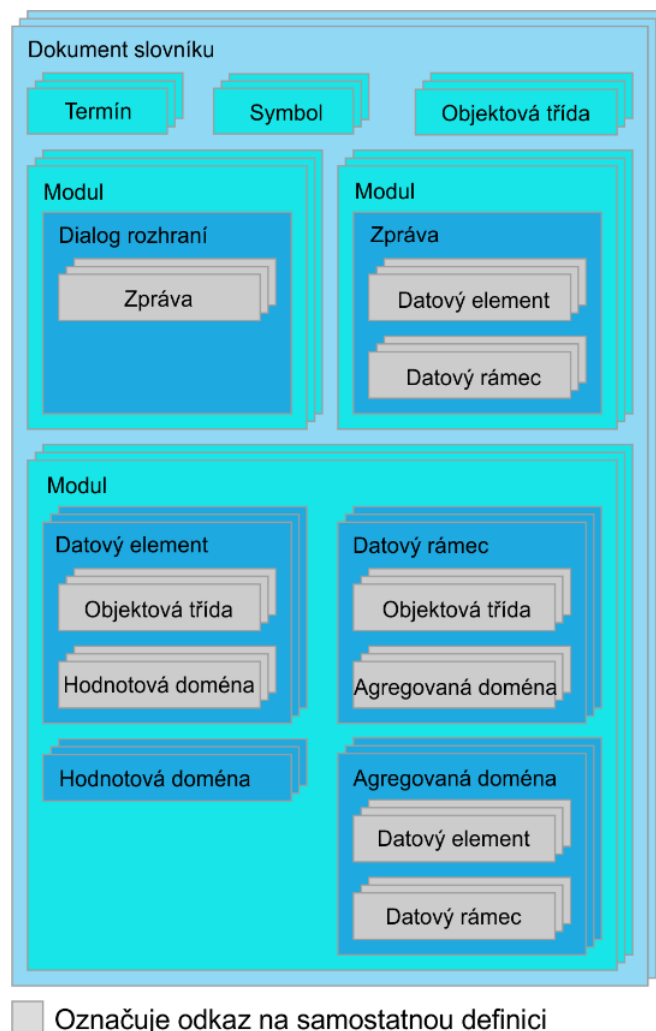
Obrázek 2 – Dokumentace datových konceptů

Obrázek 2 poskytuje přehled toho, jak spolu devět datových konceptů souvisí a jak je lze dokumentovat.