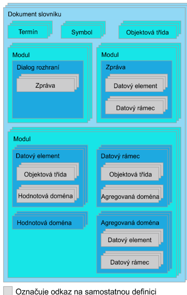
Obrázek 2 – Dokumentace datových konceptů

Obrázek 2 poskytuje přehled toho, jak spolu devět datových konceptů souvisí a jak je lze dokumentovat.