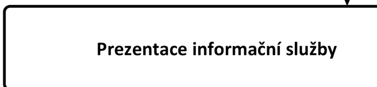
Obr. 2: Struktura řetězce životního cyklu ITS služby (obr. A.7 normy)

Základním úkolem části „Zajištění obsahu“ je sběr dat z čidel, jejich agregace a doručení výsledku části do „Zajištění služby.“ Tato část přímo provádí samotnou ITS službu, kterou může být jak složité předzpracování získaného obsahu, tak relativně jednodušší ITS služby zaměřené na bezpečnost (např. omezení rychlosti). Výsledek je následně předán části „Prezentace služby“, která realizuje prezentaci výsledků služby uživateli odpovídajícím způsobem.