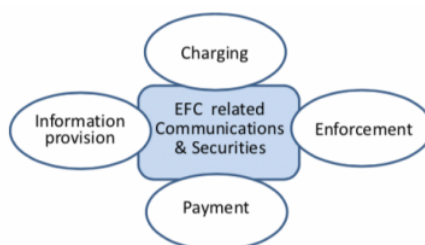
Obrázek 2 - Model EFC systému (obrázek 2 normy)

Funkční požadavky, resp. jejich specifikace, zohledňuje výše uvedenou strukturu modelu EFC systému a týká se zejména tarifního schématu, požadované kvality služeb a detekce porušení pravidel mýtného systému.