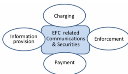
Obrázek 2 - Model EFC systému (obrázek 2 normy)

Funkční požadavky, resp. jejich specifikace, zohledňuje výše uvedenou strukturu modelu EFC systému a týká se zejména tarifního schématu, požadované kvality služeb a detekce porušení pravidel mýtného systému.