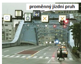
Obrázek 2 — Informace o jízdních pruzích (D.1.3 s přehledem informačních služeb k jízdnímu pruhu)

Příkladem je zprostředkování informací o pozemní komunikaci s jízdním pruhem pro proměnný směr jízdy vozidel, který je navržen za účelem zmírnění kongesce.