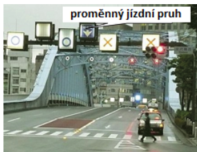
Obrázek 2 — Informace o jízdních pruzích (D.1.3 s přehledem informačních služeb k jízdnímu pruhu)

Příkladem je zprostředkování informací o pozemní komunikaci s jízdním pruhem pro proměnný směr jízdy vozidel, který je navržen za účelem zmírnění kongesce.