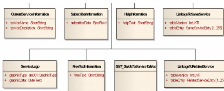
Obrázek 2 - Obecné třídy SNI stanovené v kapitole 8 dokumentu (výřez obr. 6 dokumentu)

Články 8.2 až 8.6 stanovují atributy (rozsahy, typy, příklady) obecných tříd (viz následující obrázek) vyskytujících se v SNI, tak jak byly tyto třídy ukázány na obrázku v kapitole 7.